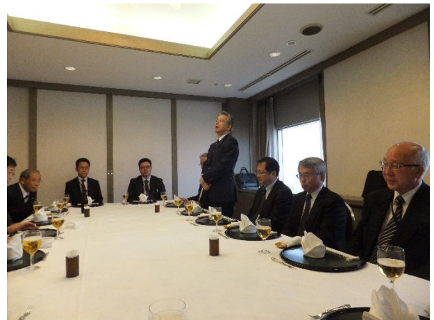
電機電子部会懇親会 田上副部長挨拶