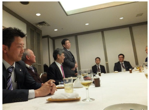
安保副部長 中締め